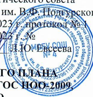
ТАБЛИЦА-СЕТКА ЧАСОВ УЧЕБНОГО ПЛАНА для 3 А, Б, В, Г, Д, Е, Ж, реализующих ФГОС НОО 2009 в соответствии с ФОП НОО 2023-2024 учебный год