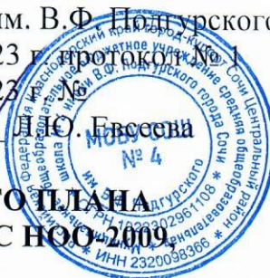
ТАБЛИЦА-СЕТКА ЧАСОВ УЧЕБНОГО ПЛАНА для 4 А, Б, В, Г, Д, Е, реализующих ФГОС НОО 2009, в соответствии с ФОП НОО 2023-2024 учебный год